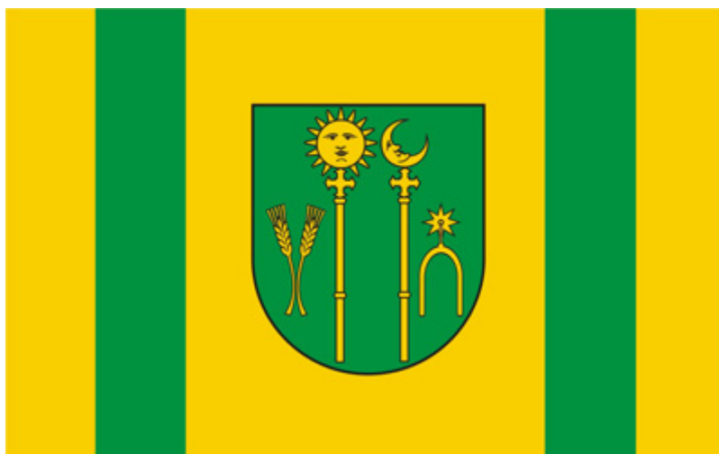
Flaga Gminy Stary Lubotyń